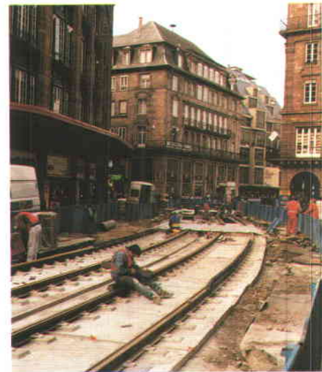
Dos imágenes de las obras de remodelación que está experimentando el centro urbano de Estrasburgo. La fotografía de la derecha recoge la Rue des Grandes Arcades: de vía de intenso tráfico a calle peatonal compatible con el tranvía.