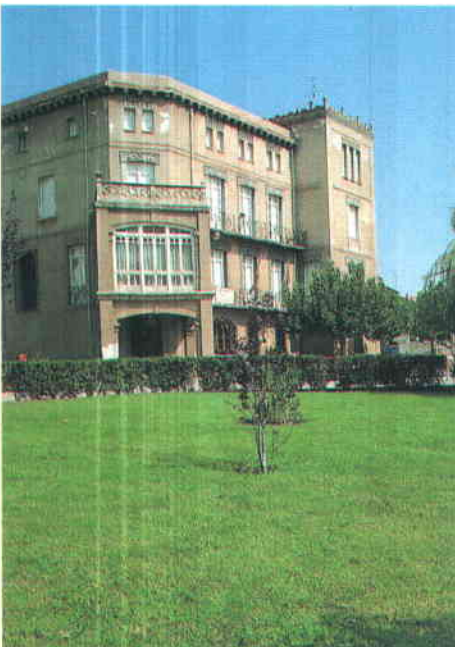
A la izquierda, el Palacio y los Jardines de la Baronesa, uno de los centros culturales más representativos de la ciudad de Arnedo. En la otra imagen, el nuevo edificio del Ayuntamiento de Logroño.

Posteriormente, Alcaldes del Partido Popular, crearon una Asociación Riojana de Municipios, cuyo Presidente era el Alcalde de