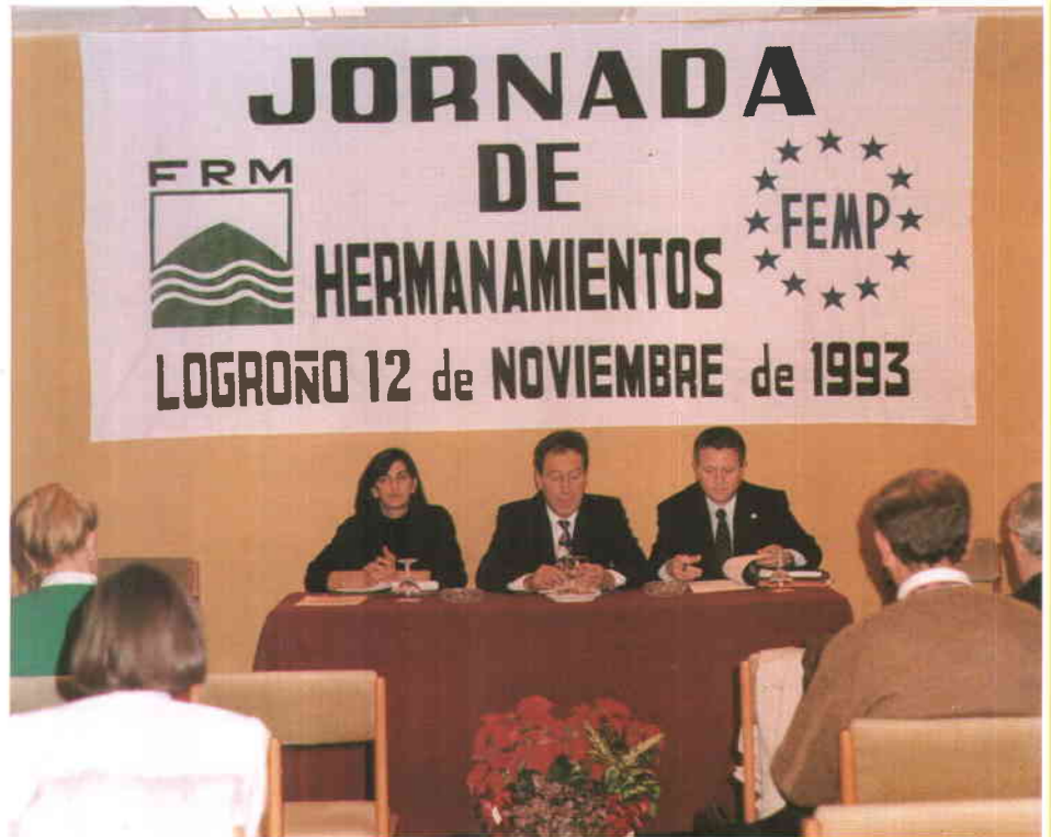
La Federación Riojana de Municipios está interesada en potenciar las actividades de hermanamiento. En la imagen, un momento de la Jornada que organizó sobre este tema, en colaboración con la FEMP, en noviembre pasado.

servió para conocer más de cerca las actividades, experiencias y perspectivas de esta actividad; por eso, la convocatoria se dirigió tanto a los municipios hermanados como a aquellos otros que no lo están todavía. Las experiencias realizadas hasta ahora han sido muy positivas; como ejemplo, en La Rioja tenemos