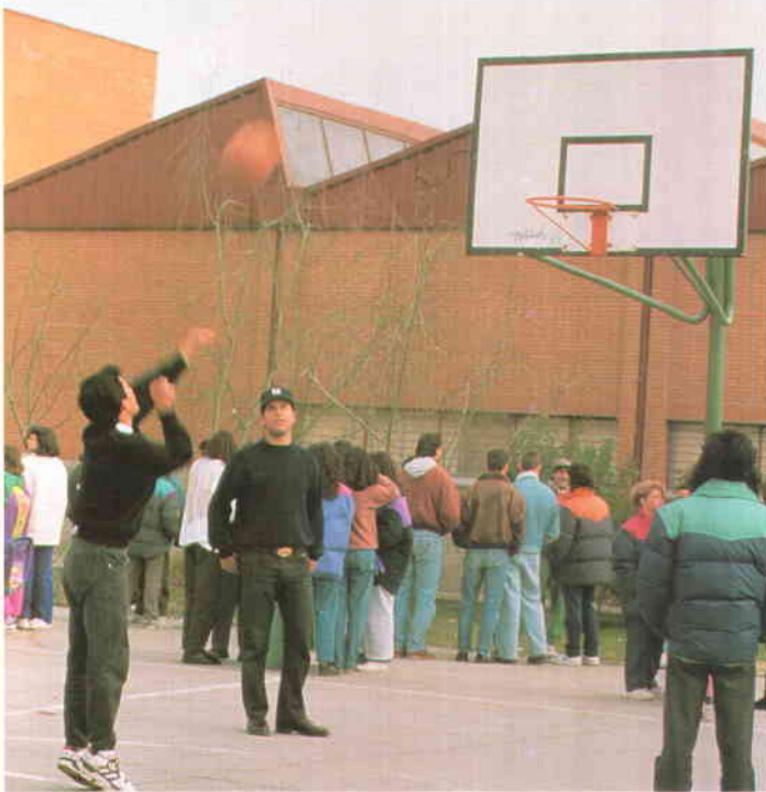
Las instalaciones de los centros docentes públicos podrán ser utilizadas para otras actividades fuera del horario lectivo, tal como queda regulado en el nuevo marco de cooperación entre el MEC y las Corporaciones Locales.

E l Gobierno ha aprobado un Real Decreto por el que establece el marco de cooperación de las Corporaciones Locales con el Ministerio de Educación y Ciencia (MEC) y regula las relaciones entre ambas Administraciones, en desarrollo de la Disposición Adicional Decimoséptima de la LOGSE. Esta norma recoge una de las principales aspiraciones de la FEMP, a cuya elaboración la Comisión de Educación ha dedicado muchas horas de trabajo. El Real Decreto sistematiza la colaboración no sólo en lo que se refiere a la conservación, el mantenimiento y la vigilancia de los centros docentes de segundo ciclo de educación infantil, educación primaria y educación especial, sino también en todas aquellas materias susceptibles de cooperación voluntaria por parte de la Administración Local. El texto potencia la cooperación entre ambas Administraciones y una concepción más descentralizada de la educación.