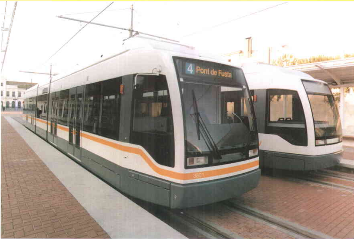
Las primeras unidades del Tranvía de Valencia, que permitirán cerrar por la superficie la red de líneas de metro del norte de la ciudad, en la estación de Puente de Madera (Pont de Fusta).

Valencia y Estrasburgo ultiman los preparativos de sus líneas tranviarias