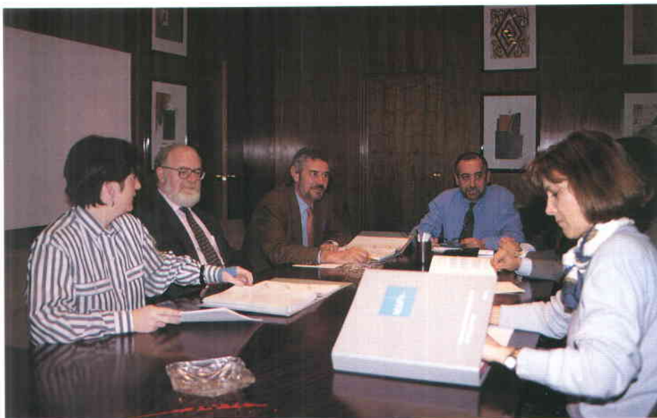
Miembros del equipo de la Dirección General de Acción Económica Territorial durante una sesión de trabajo

Sección Especial: Orientada a financiar programas de Acción Especial en áreas