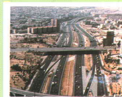
La conexión de las redes interurbanas con las ciudades es una de las prioridades del Programa.

Respecto a los criterios, los redactores del plan han tenido en cuenta en primer lugar la necesidad (evaluando aspectos como la densidad del tráfico, la población afectada, la congestión y otros urbanísticos y medioambientales); la rentabi-