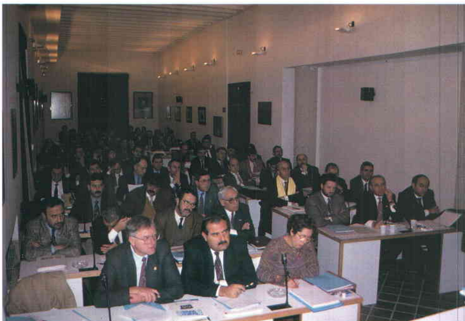
El acuerdo con el Ministerio de Economía y Hacienda suscitó fuertes debates durante la sesión del Consejo Federal.

El Consejo Federal decidió establecer como plazo hasta el 1 de junio próximo para volver a examinar la marcha de las negociaciones sobre cada uno de los asuntos analizados, sobre todo los que se refieren al nuevo sistema de participación en los Tributos del Estado para este quinquenio. Los resultados de esta negociación condicionan una parte importante de la financiación local, las posibles modificaciones de la Ley de Haciendas Locales, y la definición del nuevo marco competencial. ■