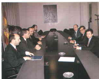
Representantes de TACSA e IBM-España durante la firma del convenio en la sede de la FEMP.

L as empresas IBM y TACSA (Técnicas Audiovisuales Comunitarias S.A.) han firmado un convenio marco de colaboración para la implantación y desarrollo de sistemas de información y servicios telemáticos para las Corporaciones Locales.