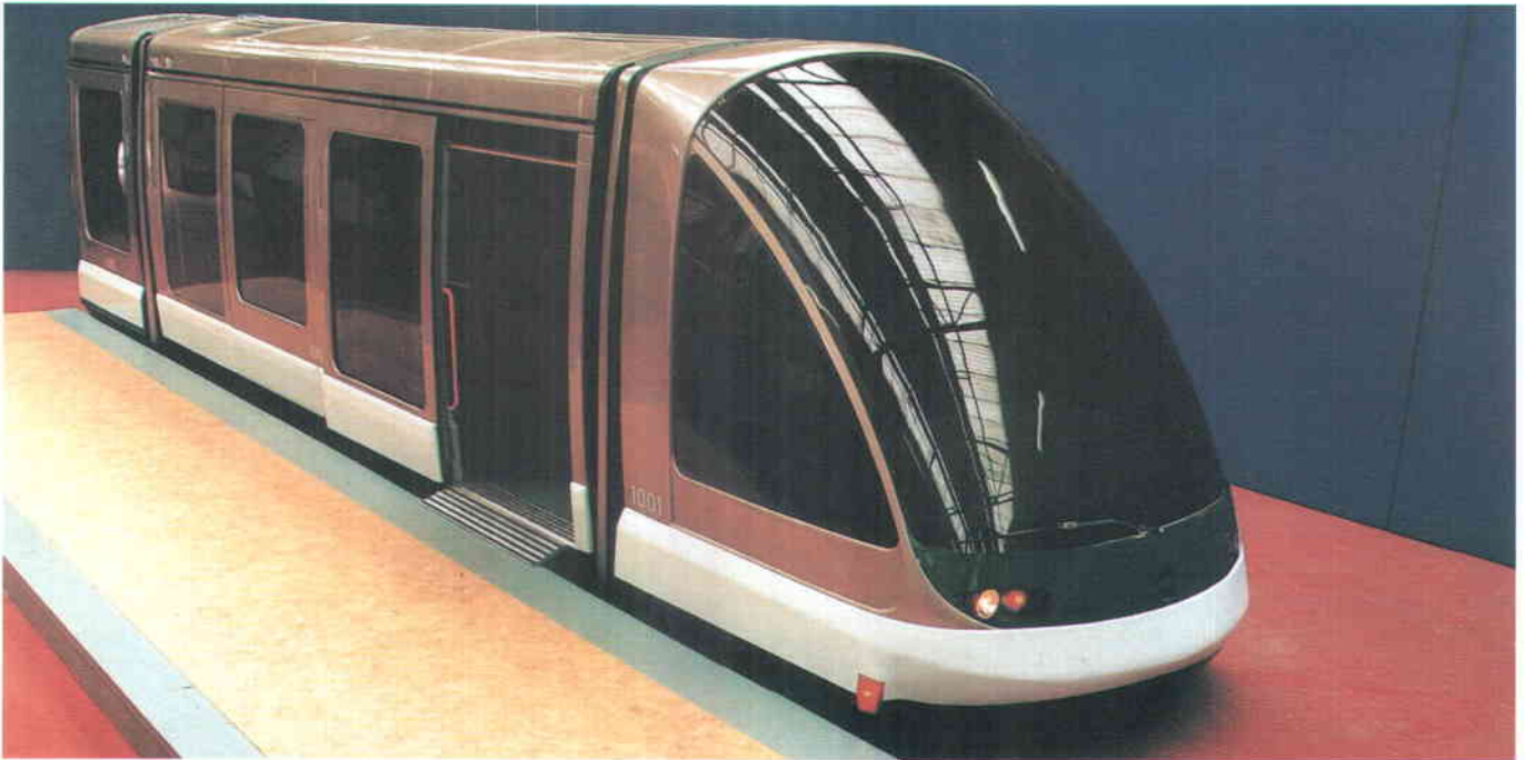
Sobre estas líneas, maqueta de una de las unidades del tranvía de Estrasburgo, en la que se puede apreciar el diseño aerodinámico del conjunto.

dos factores más: la incorporación de seis grandes puertas de acceso a cada lado del tren y la plataforma baja, que permitirán a los viajeros entrar y salir de la unidad en un tiempo mínimo.