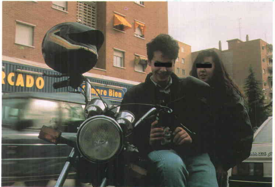
Una buena parte de los accidentes se han producido en vehículos de dos ruedas. El Plan de Seguridad Vial para 1994 prevé medidas especiales de vigilancia y control para este tipo de vehículos, de forma especial la utilización de cascos de seguridad y los controles de alcoholemia.

El informe aporta datos respecto a las prioridades sobre seguridad vial en 1992. En lo que se refiere a velocidad , se realizaron 20 millones de controles, de los cuales un 4 por 100 fueron infractores. Respecto al uso de cinturón de seguridad , el informe aporta datos contradictorios: por un lado, decrecen las denuncias por su falta de utilización, mientras que, por otro, se constata, a través de los accidentes, que esa falta de utilización, sobre todo en los conductores, es cada vez mayor. Lo que sí experimenta un aumento fuerte es la utilización del casco de seguridad , aunque su uso (un 46 por 100) es todavía muy pequeño. Otra de las causas de accidentalidad es el alcohol . En este caso se advierte una progresiva elevación de las pruebas positivas como consecuencia de los controles efectuados en caso de accidente, de infracción grave o preventivos; pero aventura que el número de muertos por accidentes de tráfico a