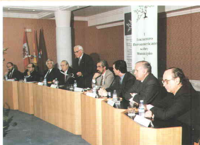
El turismo rural constituye una de las esperanzas para hacer frente a la crisis agraria. En la fotografía, un momento del acto inaugural del Encuentro durante la intervención del Presidente de la Diputación Provincial de Segovia, Atilano Soto Rábanos.

Al ubicarse, en buena parte, las actividades de turismo rural en suelo no urbanizable contemplado en la legislación de forma negativa, los asistentes consideraron necesario elevar a las instituciones con capacidad normativa la petición de desarrollo de una legislación que, siendo respetuosa con las características del suelo no urbanizable, defina de forma clara los usos que pueden admitirse y que sean compatibles con el turismo rural. ■